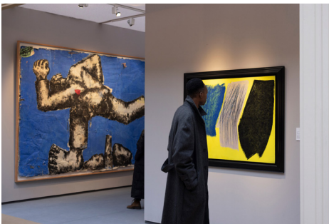
Le stand d'Opera Gallery lors de FAB Paris 2024.

« Les marchés de niche, comme le dessin ancien ou le livre ancien, sont relativement stables avec des collectionneurs et des institutions qui sont présents au salon chaque année. »